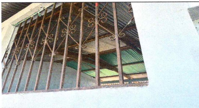
Foto 3: Balcones en mal estado y blandos, expuesto todos los materiales didacticos y escritorios.