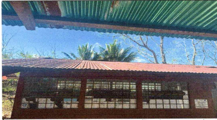
Foto 2: Se observa entechado detereorado y se filtra el agua, causando humedad.