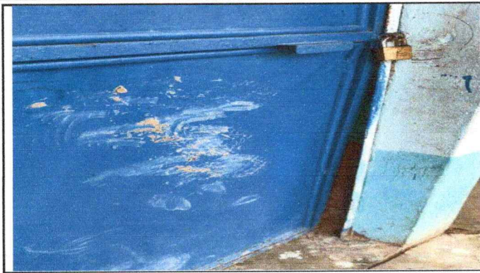
Foto 1: se observa puertas deterioradas, expuesta a robos los escritorios.